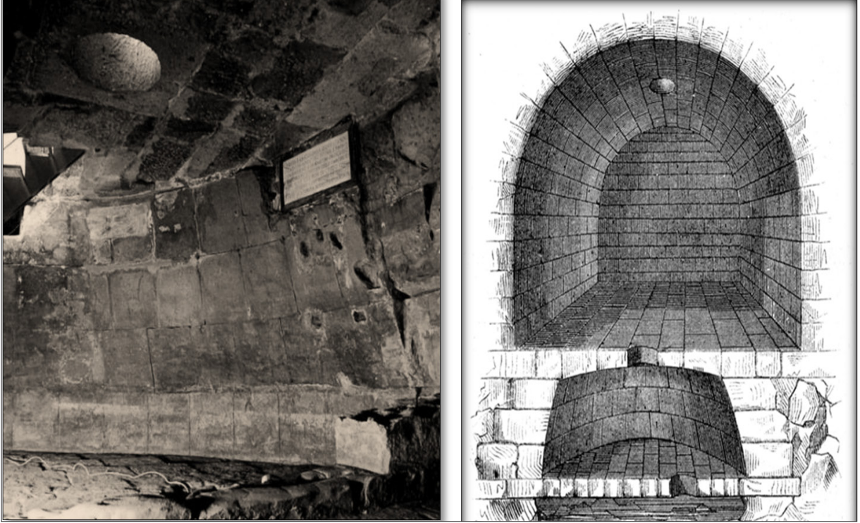
Görsel 1. Zindan ya da Carcer diye adlandırılan, günyüzü görmeyen ortaçağ hapisaneleri

Tarihin ilk dönemlerinde bugünkü anlamda hapis-haneden bahsedilmez. Kurulu sisteme karşı gelen suç işlemiş olur ve bu yüzden "suç" kavramı vardır. Eğer suç varsa da bunun karşılığı olarak da ceza vardır. Cezalandırma ilk çağlardan itibaren çok çeşitli yöntemlerle icra edilmiştir. Suça karşı hemen insan hayatını ortadan kaldıran çok vahşi cezalandırma biçimleri ilk çağlarda görülmüştür.