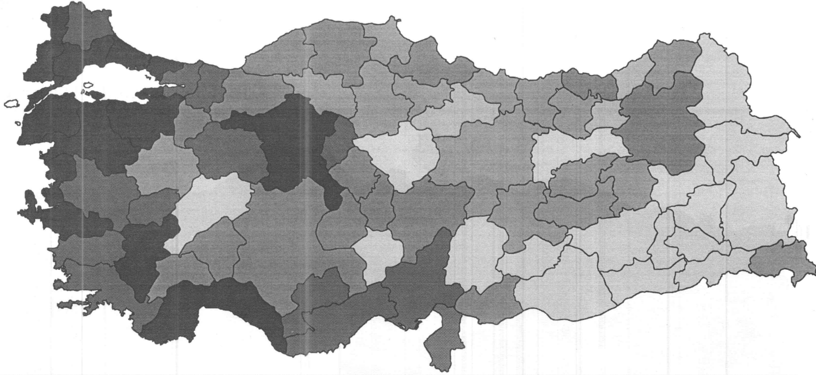
10.000 KİŞİYE DÜŞEN DİŞ HEKİMİ SAYISI, 1994